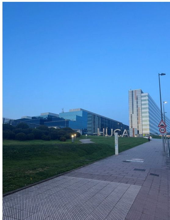
HOSPITAL UNIVERSITARIO CENTRAL DE ASTURIAS (HUCA) NO ĀRPUSES PĒCPUSDIENĀ