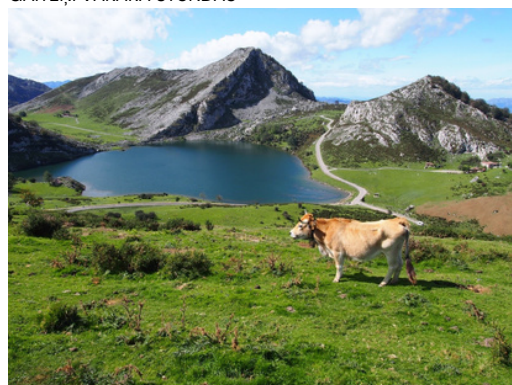
"LAGOS DE COVADONGA" JEB KOVADONGAS EZERI "PICOS DE EUROPA" KALNU GRĒDĀ AR RAKSTURĪGO VIETĒJO GOTIŅU FONĀ